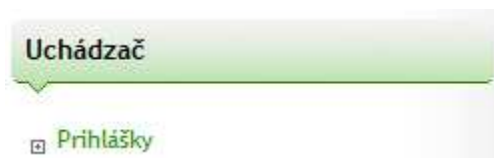
Obr. č. 2: Prihlášky

Po uložení osobných údajov kliknite na „Prihlášky“ v menu „Uchádzač“ (obr. č. 2).